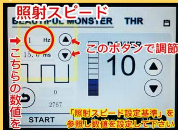
⑤照射スピード設定